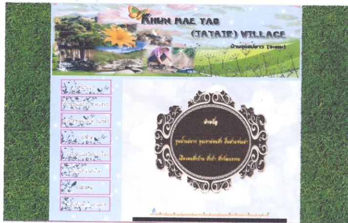
ภาพที่ 4.1 หน้าหลักเว็บไซต์หมู่บ้านขุนแม่ยาว